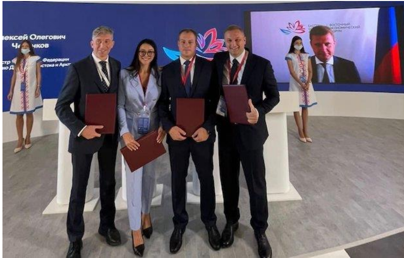
照片三：新加盟投資者在最近的 2021 年遠東經濟論壇公佈

同時，Tsifetakis 先生簡介了水晶虎宮殿二期的非博彩設施。當二期竣工後，酒店客房數量將增加至超過 400 間，即目前的三倍。該地區最大的瓶頸之一是酒店客房數量不足，客房及娛樂的需求供不應求，從水晶虎宮殿的酒店客房在週末幾乎都爆滿便可見一斑。Tsifetakis 先生預告，二期將設有一個多層複合室內恆溫池，這在遠東地區實屬罕見，可讓客人在俄羅斯遠東地區冰雪寒冷的冬季中在海邊享受熱帶地區的夏季，加上刺激好玩的池畔派對，水晶虎宮殿破天荒將全年池邊派對的樂趣帶入遠東。